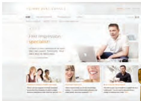
Futura Dent Estetica www.futuradentestetica.com

Čisto osvježeno na hrvatskom korporativnom web prostoru, kako na razini korištenja svih mogućnosti prezentacije djelatnosti putem interneta, tako i na razini dizajnerskog i sadržajnog rješenja. Stranica je dinamična, ali ne i agresivna. Puna je informativnog sadržaja, ali nije dosadna, nego i duhovita. Izbjegnuti su svi klišeji i postignuta originalnost. Potpuno je u funkciji osnovne poruke: Mi nismo obični stomatolozi, naš pristup se razlikuje o uobičajenih!