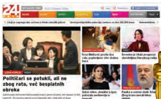
24 sata www.24sata.hr

Portal koji sadržajno nadopunjuje novine 24 sata raznovrsnim informacijama, od politike, sporta, zanimljivosti, ima veliki broj kvalitetnih fotografija i videa iz vlastite produkcije, omogućena je dvosmjerna komunikacija, integracija s društvenim mrežama. Dizajn je moderan, logična navigacija, lako se dolazi željenih informacija, jednostavno je čitanje RSS kanala. Portal je dobro osmišljen i ima sve što jednu stranicu čini kompletnim paketom.